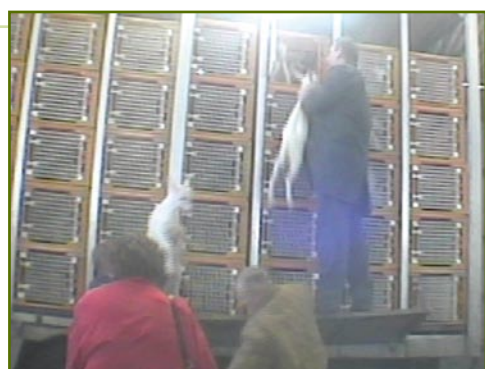
Des conditions de transport inadmissibles dénoncées par nos enquêteurs.