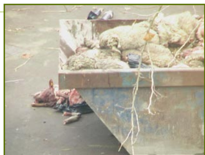
La mairie de Roubaix a mis des bennes à disposition des personnes ayant égorgé des moutons en différents endroits de façon illégale, une situation intolérable contre laquelle la PMAF a protesté.

En effet, elles imposent des souffrances importantes, un grand stress inhérent au long voyage vers le Moyen-Orient, et des méthodes d'abattage utilisées particulièrement cruelles. Nous allons désormais concentrer nos efforts tout particulièrement pour contrer les exportations d'animaux depuis le Brésil et l'Australie vers le Moyen-Orient. Pour mener à bien cet objectif, un comité de pilotage a été constitué, il sera coordonné par une jeune membre de la PMAF qui vient d'obtenir un Master de Commerce et Management des Affaires internationales. Notre objectif est que les pays du Moyen-Orient remplacent leurs importations d'animaux vivants par des importations de carcasses. Vous pouvez soutenir ce projet en nous adressant un don, ou, si vous connaissez particulièrement bien le Moyen-Orient, vous pouvez vous associer à notre groupe de travail qui se réunira régulièrement à Paris et travaillera par l'échange de courriels. ●