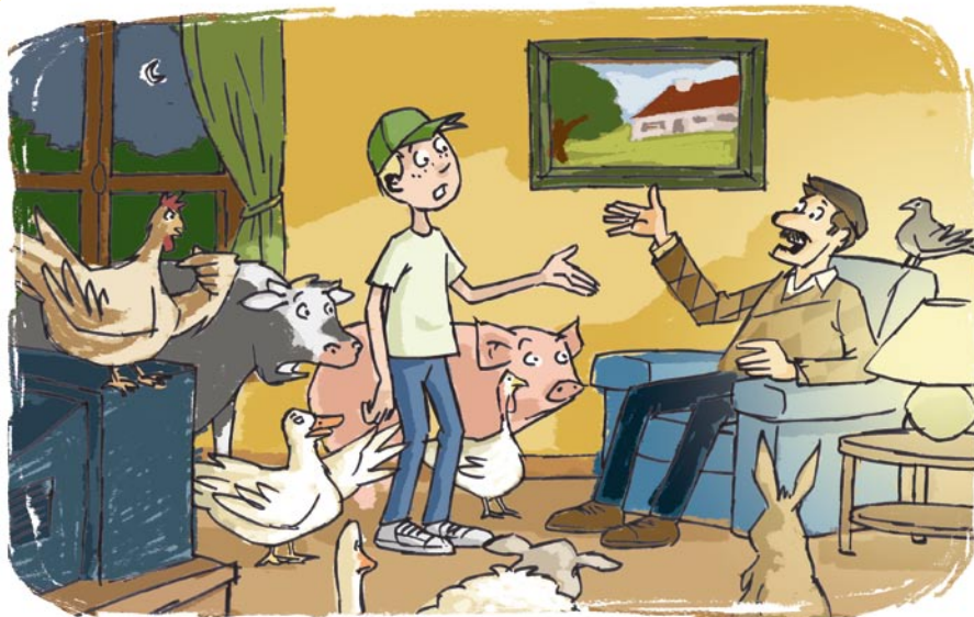
Illustration : Nicolas Humerblais - PMAF