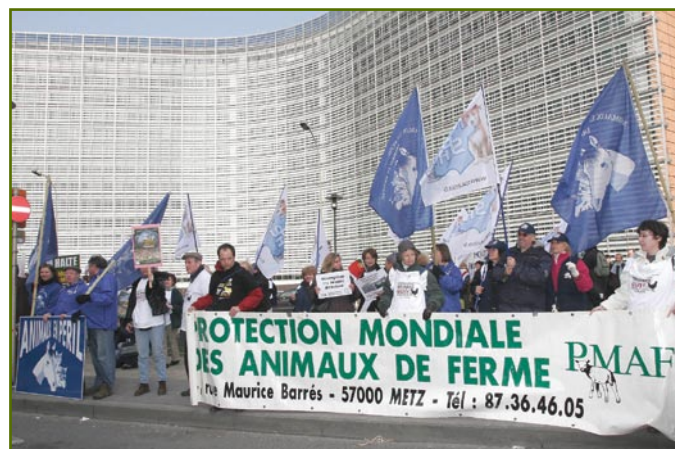
De nombreux membres de la PMAF sont venus manifester devant le Conseil des ministres de l'Union européenne à Bruxelles, le 20 mars dernier.

Nous avons évoqué le projet de Directive européenne pour la protection des poulets dans les élevages dans le dernier numéro de Champ Libre . La Directive devrait être adoptée au printemps prochain. Nous avons organisé une manifestation à Bruxelles le 20 mars 2006 à l'occasion du Conseil des ministres de l'agriculture de l'Union européenne pour les inciter à adopter une directive la plus progressive possi-