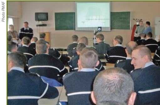
La PMAF intervient régulièrement auprès des escadrons afin de les sensibiliser à la réglementation.

En janvier dernier, l'ensemble des gendarmes formateurs nationaux ont eu droit à notre présentation de la réglementation protégeant les animaux en cours de transport.