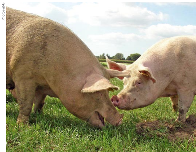
Grâce à la « Ferme des animaux », il sera bientôt possible de recueillir les animaux de ferme victimes de mauvais traitements et de leur apporter durablement les soins, l'hébergement et le réconfort dont ils ont été cruellement privés durant des années de labeur.

Les chevaux, bovins, moutons, porcs, chèvres, ânes, lapins, poules, poulets, oies, pintades, dindes (...) recueillis trouveront chacun des pâturages et des abris adaptés à leurs besoins.