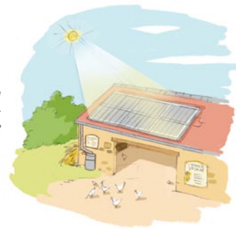
L'ensemble du projet sera conçu dans un souci d'inté- gration et de protection de l'environnement.