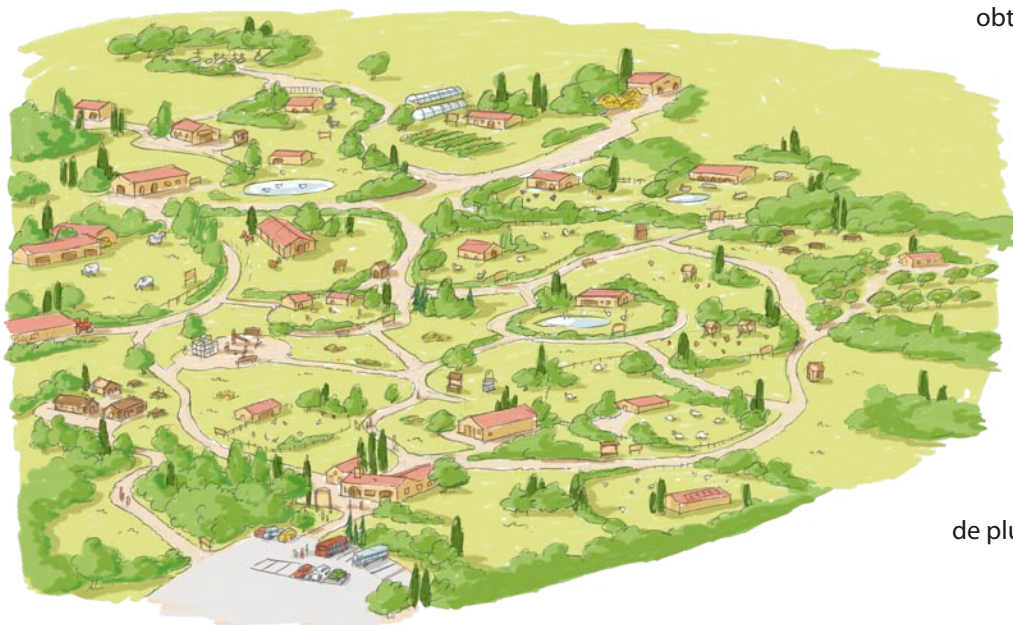
Vue d'ensemble du projet de la « Ferme des animaux » : 10 à 15 hectares pour l'accueil d'environ 200 animaux.