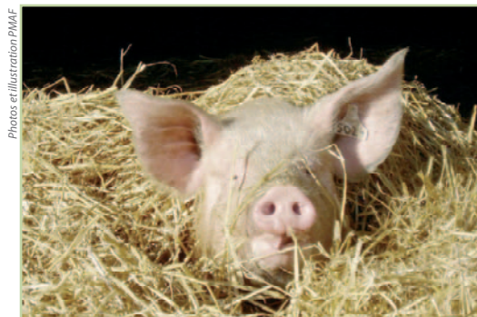
Seuls l'élevage en plein air et l'élevage en groupe sur paille permettent de satisfaire la nature sociale et curieuse des cochons.