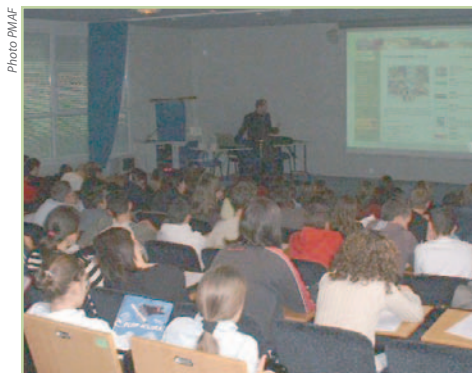
Les élèves sont très attentifs aux interventions de la PMAF.