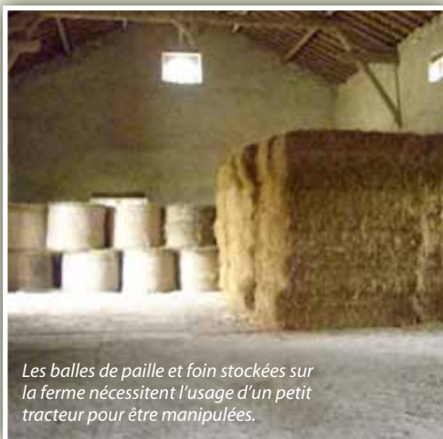
Les balles de paille et foin stockées sur la ferme nécessitent l'usage d'un petit tracteur pour être manipulées.