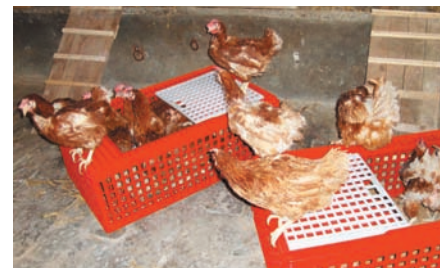
Les poules découvrent leur nouvel environnement, encore troublées par tant d'espace...

Il n'a fallu aux poules que quelques jours pour s'approprier l'ensemble du corps de ferme et profiter d'une vraie vie de poule : bain de poussière et bain de soleil, chasse aux insectes et picorage... une réelle liberté pour oublier la triste vie en cage qu'elles avaient connue jusque là.