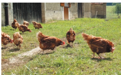
Premiers pas en extérieur : à la découverte de la liberté !

Les événements ne s'arrêtent pas là puisque, quelques jours après, nous recevons deux appels à l'aide pour des cochons. Le propriétaire d'un restaurant routier retrouve sur son parking une jeune truie de 6 semaines, probablement tombée d'un camion la transportant vers un élevage d'engraissement. Plein de compassion, il a recueilli le porcelet dans un petit enclos et nous a contactés afin de le sauver.