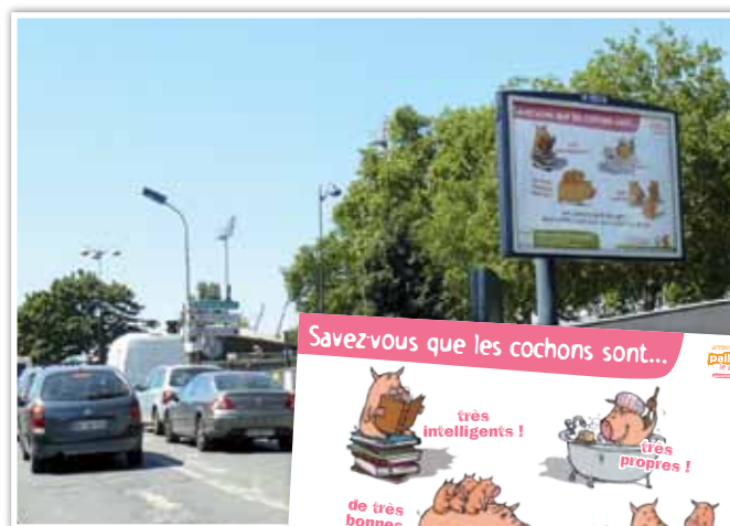
Durant l'été, une centaine d'affiches ont été placées à Paris et Metz.

Savez-vous que les cochons sont très propres et qu'ils séparent leurs différentes zones de vie (aire d'alimentation, aire de couchage, aire de déjection) ? Savez-vous que les truies sont de très bonnes mères qui construisent un nid avant la mise-bas pour accueillir leurs porcelets ? Ces quelques exemples de comportements du cochon révèlent à quel point nous méconnaissons cet animal sensible et