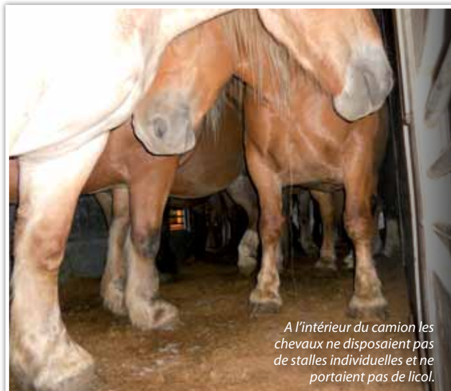
A l'intérieur du camion les chevaux ne disposaient pas de stalles individuelles et ne portaient pas de licol.

La récurrence de ce type d'infraction nous interpelle une nouvelle fois sur les lacunes de la réglementation régissant le transport d'animaux vivants. L'interdiction des transports « longue distance » pour les animaux constituerait un aboutissement essentiel pour le bien-être des animaux. La