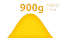
RATION DURANT GAVAGE