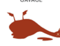
TAUX DE MORTALITÉ DURANT LA PÉRIODE DE GAVAGE 10 à 20 fois supérieur à la normale

Source : Pingel H., et al., 2012, Production de canards, 251 p.