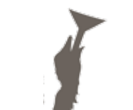
PHASE DE GAVAGE 12-14 jours